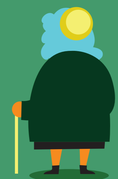
Infragestellung des bisherigen Lebens