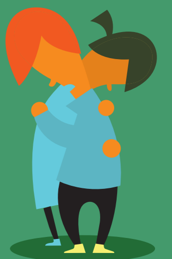
Scham und Verleugnung des Suizids