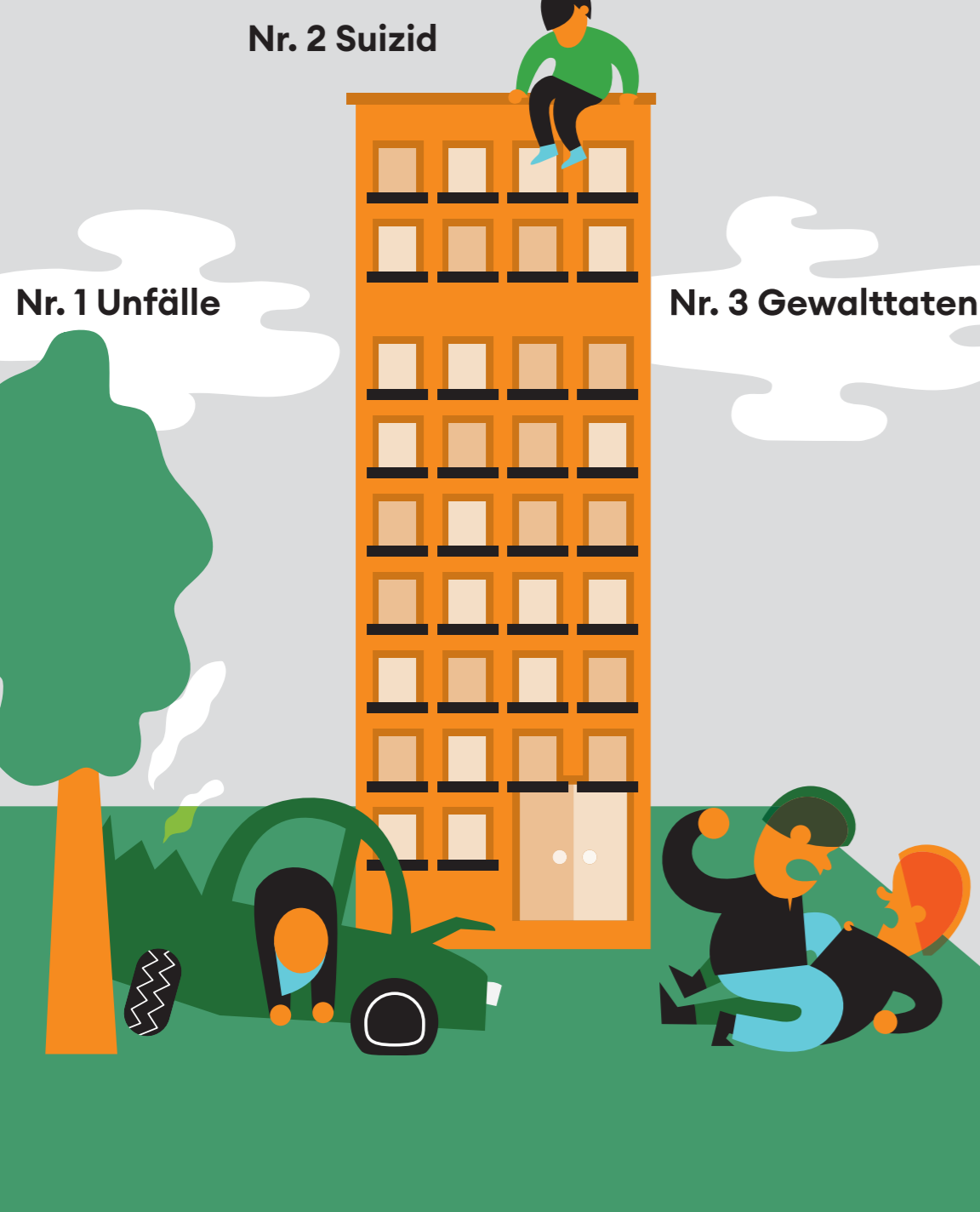
Die häufigsten Todesursachen bei Kindern und Jugendlichen bis 25 Jahre in Deutschland