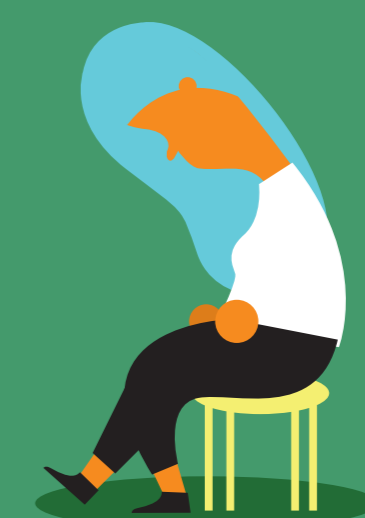
Schuld und Versagen